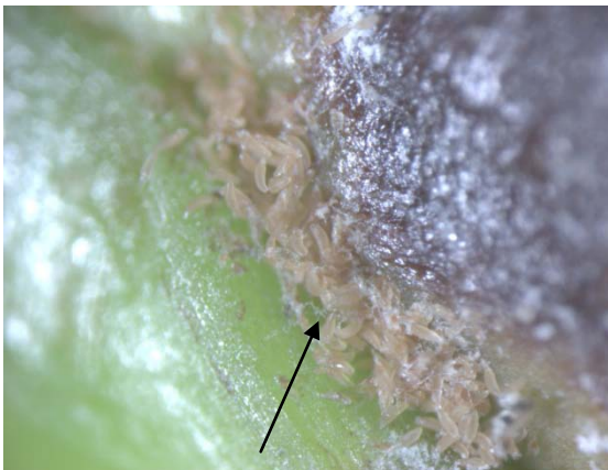
Bild 1. Hallonbladgallkvalster i knopp för övervintring

Denna rapport kommer att publiceras på Rånna försöksstations hemsida: www.slu.se/ranna . Resultaten kommer att presenteras för rådgivare och odlare vid kurs i Hook, den 30 november 2011 samt vid Nordisk Bärkurs i Åbo 6-7 februari 2012